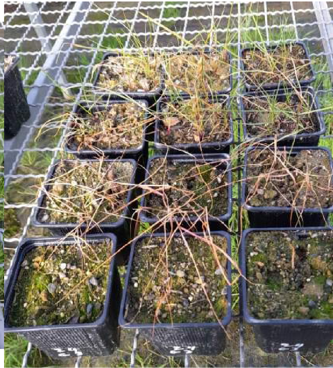
540 y 1080 gai/ha