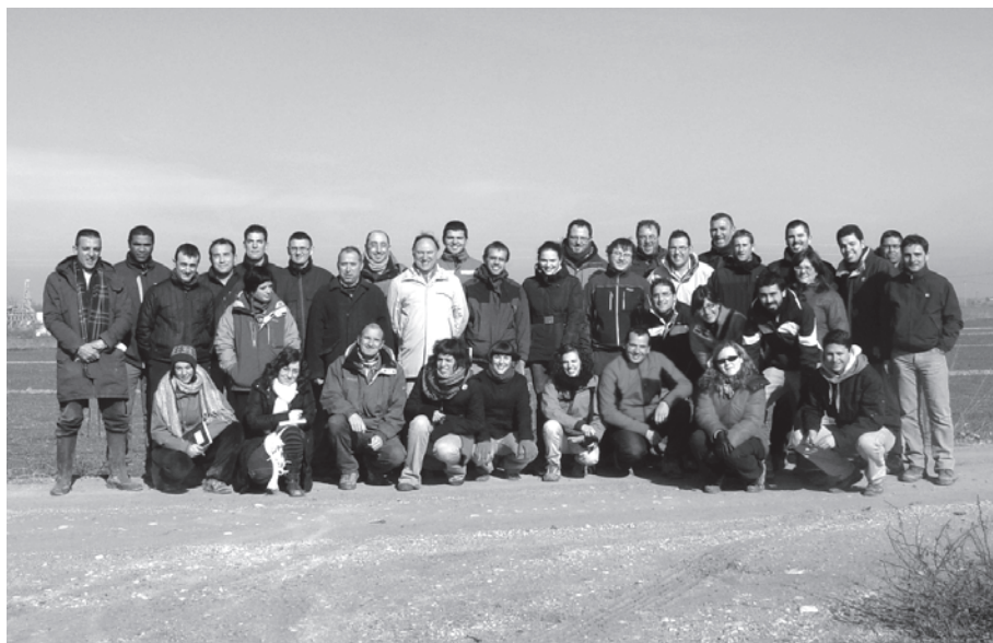
Los asistentes al XIV curso de reconocimiento de plántulas de malas hierbas

Al curso asistieron un total de 32 personas. Varios de ellos miembros de empresas de ensayos, representantes de empresas de fitosanitarios y técnicos de empresas de distribución. Participaron en el curso los estudiantes del master de Protección Integrada de Cultivos que se imparte en dicho centro durante el presente curso académico. Se contó también con la participación de estudiantes que realizan sus trabajos final de carrera o de doctorado en grupos de malherbología de otros centros o universidades. Los asistentes dispusieron de amplia documentación escrita y gráfica de los contenidos impartidos así como de un ejemplar del libro "Malas hierbas en plántula. Guía de identificación". La Sociedad Española de Malherbología financió parte de la matrícula a los estudiantes inscritos al curso y les facilitó la obra citada.