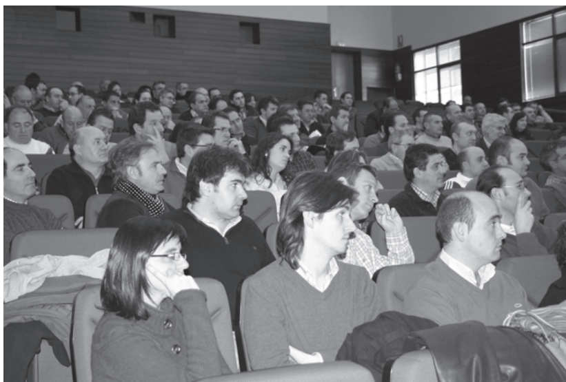
Las Jornadas Técnicas de Maíz organizadas por la SEMh, resultaron un éxito de asistencia

Según las 46 encuestas recogidas, la asistencia se repartió en 78% técnicos de empresas, 6% técnicos de cooperativas, 4% empresas de fabricantes de fitosanitarios, 4% agricultores, 4% pertenecientes a la administración pública y 4% de comerciales. El 80% de los asistentes fueron no socios de la SEMh y el 69% de ellos manifiestan su interés en pertenecer a la Sociedad. En vista de los resultados de las encuestas (0% deficiente, 20% bien, 74% notable, 6% sobresaliente), la SEMh se une a la satisfacción expresada en las mismas y hace una valoración muy positiva de dichas Jornadas.