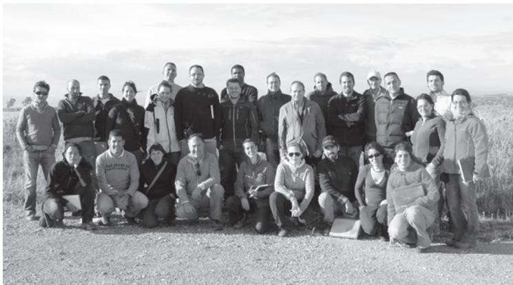
Los asistentes al VI curso de reconocimiento de malas hierbas de cultivos de verano

En un ambiente agradable (aunque atmosféricamente más bien fresco) el interés mostrado por los participantes y la presencia de las siempre "fieles" malas hierbas, ayudaron a alcanzar con éxito los objetivos del curso.