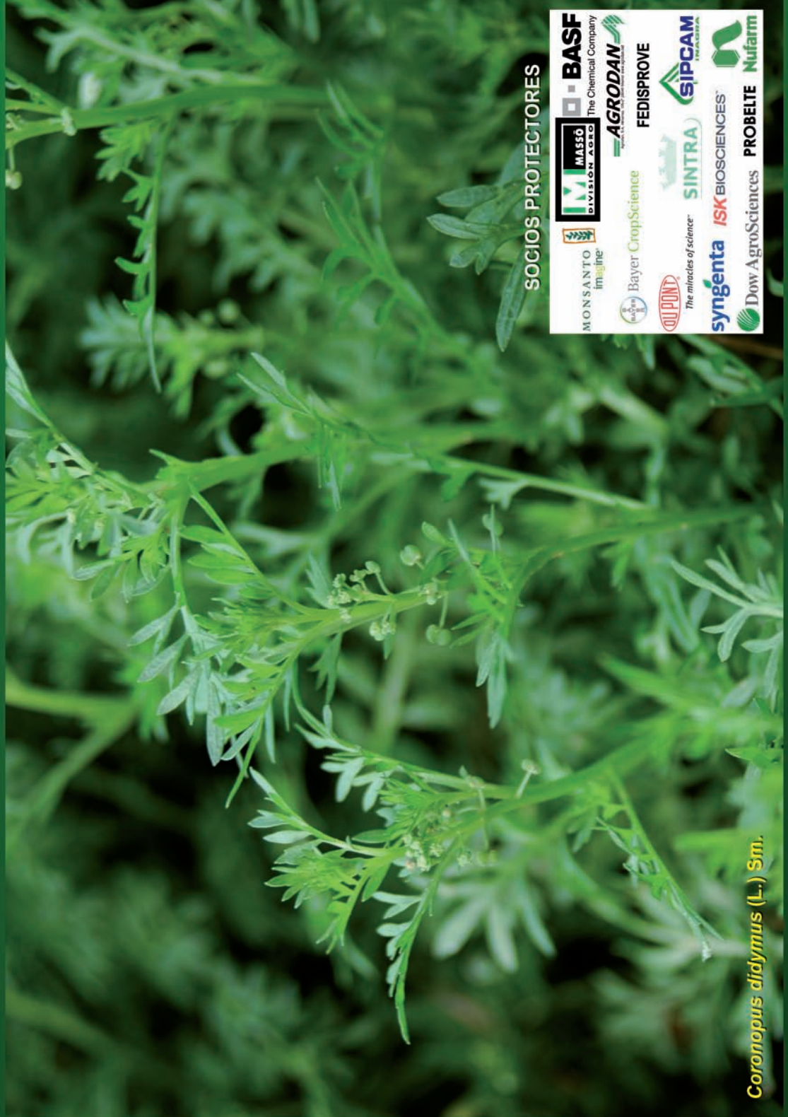
Coronopus didymus (L.) Sm.