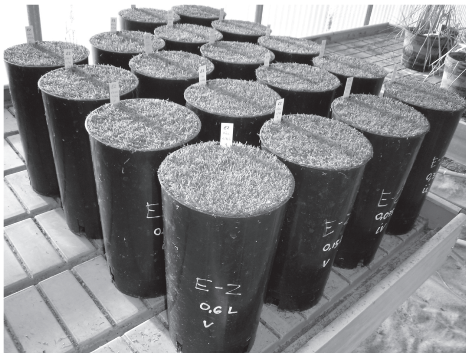
Figura 1: Ensayo nº 2. Césped de Agrostis stolonifera .

Los resultados mostraron cómo el número de inflorescencias es muy bajo, pese a ello en los ensayos 1 y 3 se observó que si los céspedes se riegan muy frecuentemente pero con poca cantidad de agua, se favorece la aparición de inflorescencias de la adventicia. En el ensayo 2 se comprobó como la especie A. stolonifera compite mejor con P. pratensis (menos inflorescencias) y que el manejo del riego, no afecta al grado de infestación de la adventicia. Respecto al ensayo 4 se observó un mayor número de inflorescencias en los céspedes segados a menor altura y con mayor frecuencia. En el ensayo 5 se comprobó cómo en aquellas macetas que recibieron el fertilizante complejo hubo una mayor tendencia a emitir más inflorescencias que las demás fuentes de nitrógeno. En el ensayo 6 se vio una mayor tendencia a la emisión de inflorescencias de P. pratensis cuando la fertilización fosforada era de 6 g/m 2 . Por último, en el ensayo 7 se pudo observar que las macetas sin aireación (controles) tendieron a emitir antes y mayor número de inflorescencias.