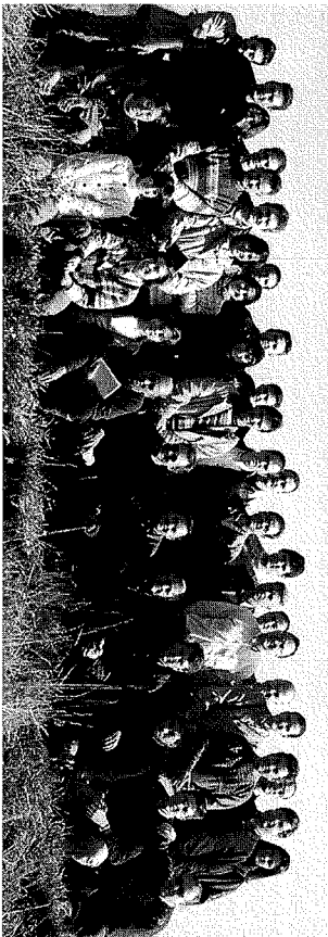
Asistentes al Curso de reconocimiento de plántulas y malas hierbas.

En dicho curso participaron un total de 32 personas, la mayoría pertenecientes a empresas de agroquímicos, aunque también asistieron técnicos de la administración (IRTA,